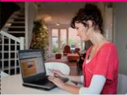
Step 1: reizen op saldo aanvragen