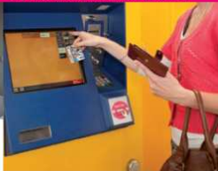
Step 2: reizen op saldo activeren aan de NS-kaartautomat