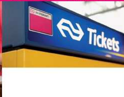
Step 3: saldo laden bij NS-kaartautomat met een legje