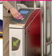
Step 4: inchecken